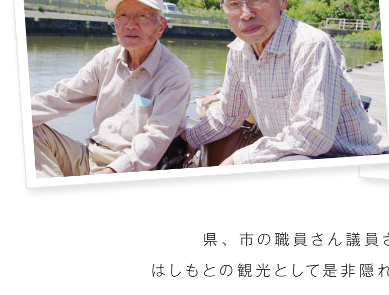
兄弟弟子の恵舟さんと 魚心観さんの2ショット!