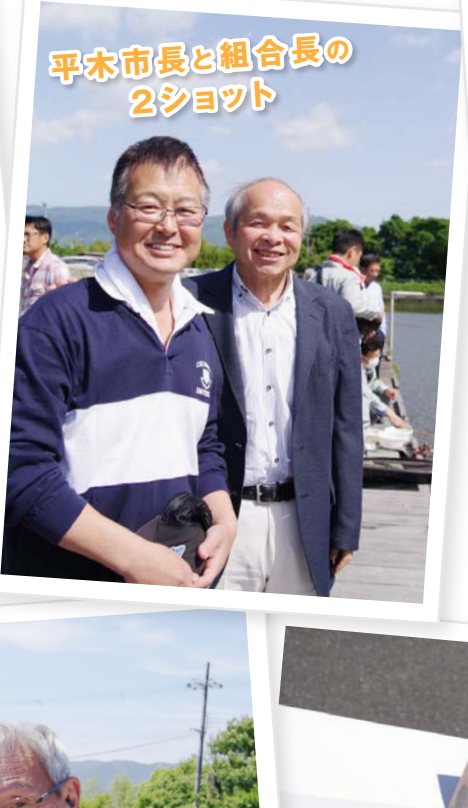
平本市長と組合長の 2ショット